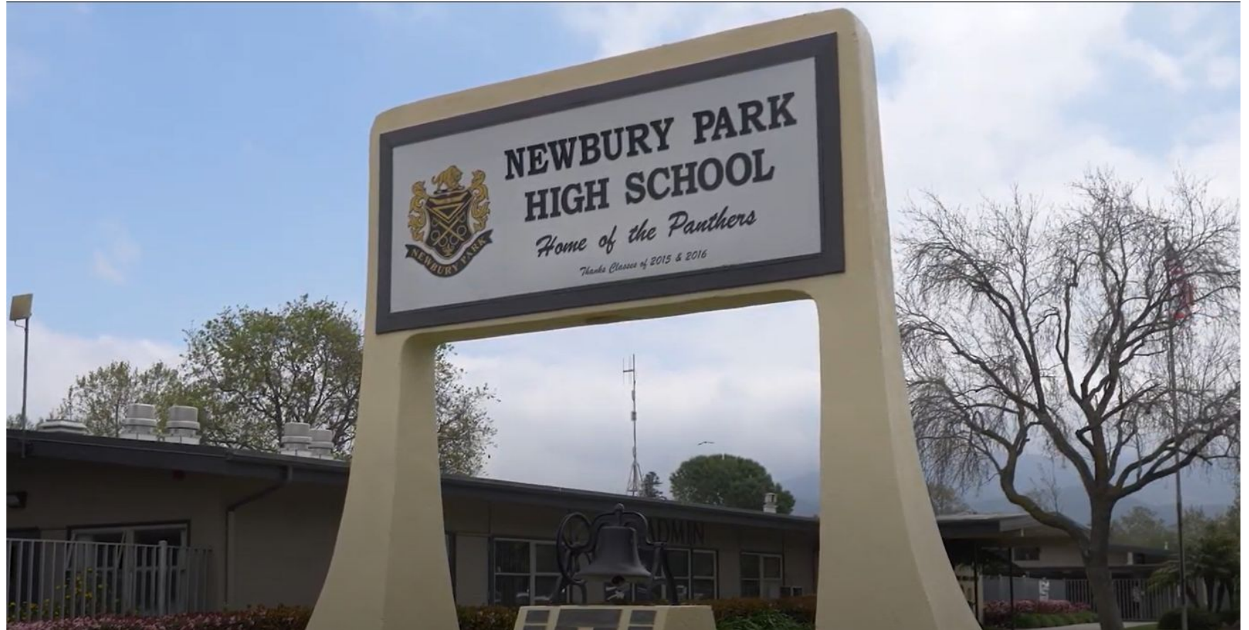
NPHS Newcomer Academy